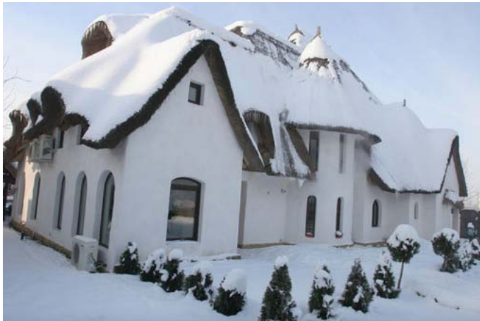
Eco-casa cu acoperiș de stuf și pereți văluriți, de 1,3 milioane euro